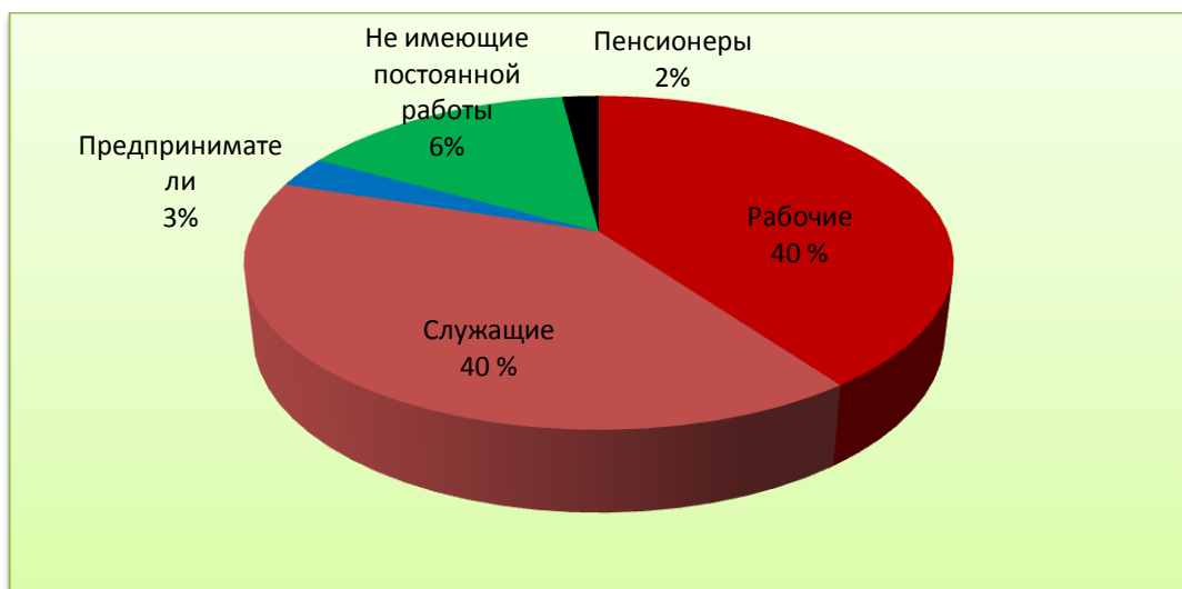
На рис.3. Представлен социальный статус семей.