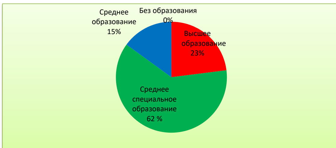
На Рис. 1. Представлен анализ образовательного уровня родителей.

Социальными заказчиками деятельности дошкольного учреждения являются, в первую очередь, родители (законные представители) воспитанников. Поэтому коллектив МБДОУ пытается создать доброжелательную, психологически комфортную атмосферу, в основе которой лежит определенная система взаимодействия с родителями, взаимопонимание и сотрудничество. Мы убеждены, что, только взаимодействуя с родителями можно добиться результатов в воспитании и обучении детей, причем наше взаимодействие мы рассматриваем как социальное партнерство, что подразумевает равное участие в воспитании ребенка, как специалистов детского сада, так и семьи. Для эффективного планирования предстоящей совместной деятельности с родителями (законными представителями) воспитанников произведен анализ контингента родителей (законных представителей). Анализ социального статуса семей показал отсутствие воспитанников из социально незащищенных семей